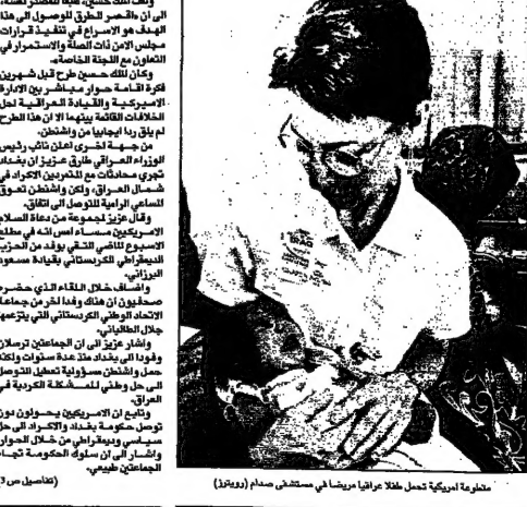
مجموعة امريكية تحمل جرحا عاليا مرضيا في مستشفى صدام (يوافق)

عمان - القدس العربي: كشفت الشرطة الامريكية عن وجود سبب سياسي وراء قتل ابنة الدبلوماسي اليميني. وقالت: «السبب السياسي وراء القتل».